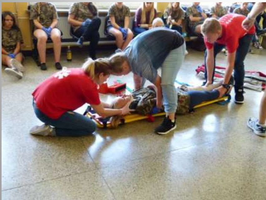
Repozycja na desce